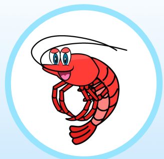
새우 안전성 : 9.6ppm

새우 없이 바닷물 도입하여 물 만들 때 소독 (24시간 경과 후 사용) : 1ppm