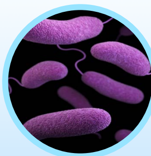
AHPND소독 : 30배 희석