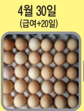
4월 30일 (급여+20일) 탈색란이 빠르게 정상화 진행 중 (통상적 회복보다 2~3배 빠름)