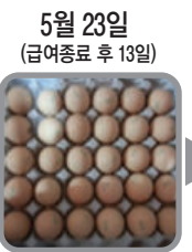
5월 23일 (급여종료 후 13일) 다시 난각질 품질 저하 발생 탈색란 발생 및 난각 연화 증가됨