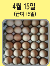
4월 15일 (급여 +5일) 난각이 두꺼워짐을 확인 탈색란이 빠르게 정상화 진행 중