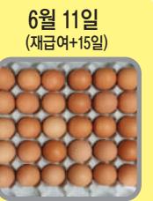
6월 11일 (재급여+15일) 5/29부터 재급여 시작 탈색란이 빠르게 정상화됨(거의 정상란!)

▶ 질병발생(APV 의심) 후 탈색란 및 난각개선을 위해 '알조아'를 투여했을 경우, 난각이 두꺼워지고 탈색란이 빠르게 정상화되었음. (통상적으로 질병 발생 후 2~3개월 후 정상 계란 상품이 될 수 있음) ▶ 미급여 시, 다시 품질 저하! ▶ 재급여 시, 바로 정상란으로 회복되었음.